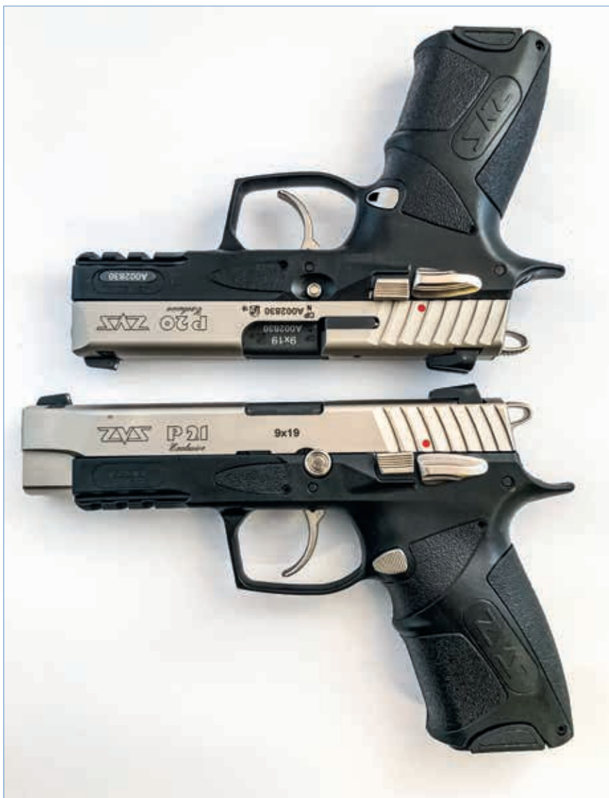
| Srovnání velikosti ZVS 20 a 21, zde v provedení Exclusive

ZVS 20 a 21 jsou moderní samonabíjecí pistole s uzamčeným závěrem. ZVS 20